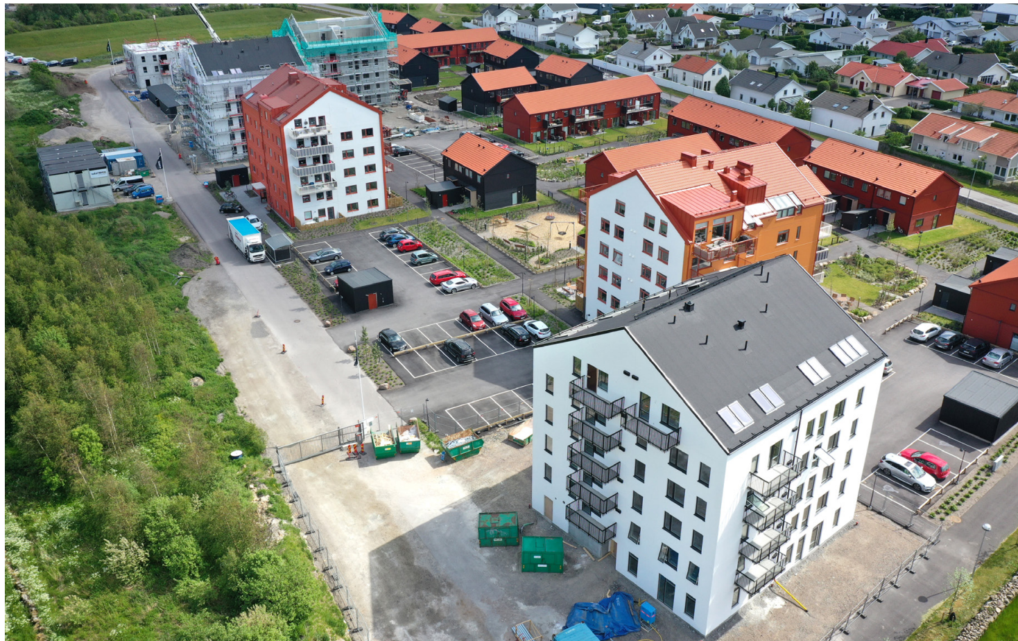
Så här ser området på Marmorlyckan ut nu. Det höga huset, nummer två från höger, ingår inte i köpet. Affären är värd 267 miljoner kronor och är ett led i Fortinovas strävan att växa och dessutom introduceras på börsen.